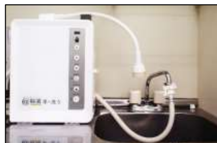
<写真>微酸性次亜塩素酸水生成装置